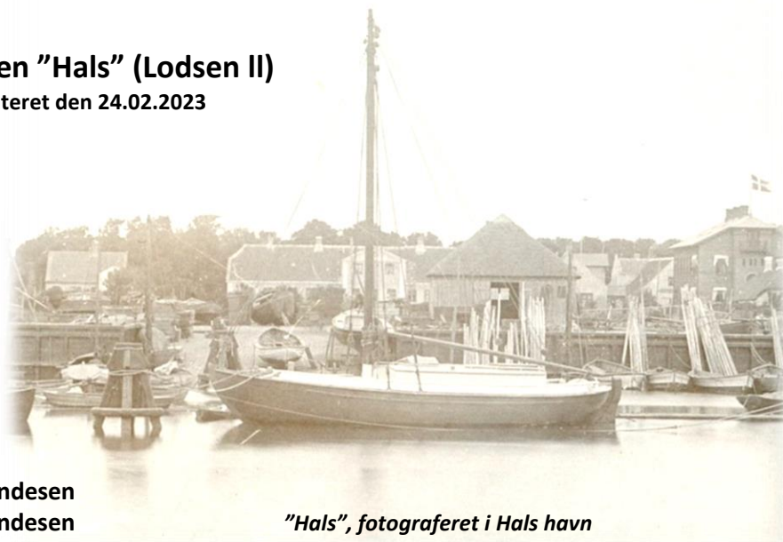
"Hals", fotograferet i Hals havn

Lodsbåden "Hals" (senere "Lodsen II), er en spidsgattet dæksbåd med traditionel lodsrigning – kullet mast, stagfok og bomløst storsejl. Båden blev udrustet med kobberforhudning, hvilket bekræfter lodstjeneste i danske fjorde. Båden blev bygget specifikt til Hals Lodseri.